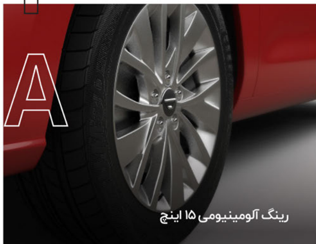
رینگ آلومینیومی ۱۵ اینچ