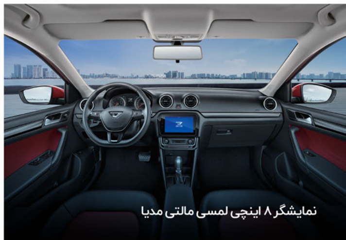
نمایشگر ۸ اینچی لمسی مالتی مدیا