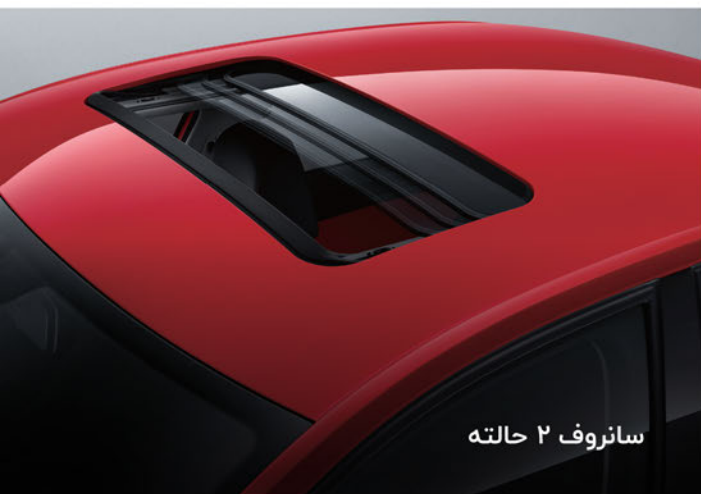
سانروف ۲ حالتہ